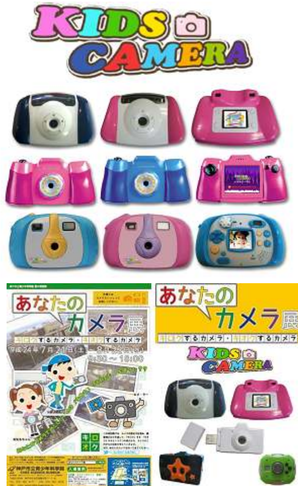
「あなたのカメラ展」 / 主催：神戸市立青少年科学館 会期：平成24年7月21日（土）～8月22日（水）

キッズカメラシリーズは、写真業界誌をはじめ、各種メディアでもご紹介をいただいております。 また、お子様向けのワークショップなどでもご利用いただいております。